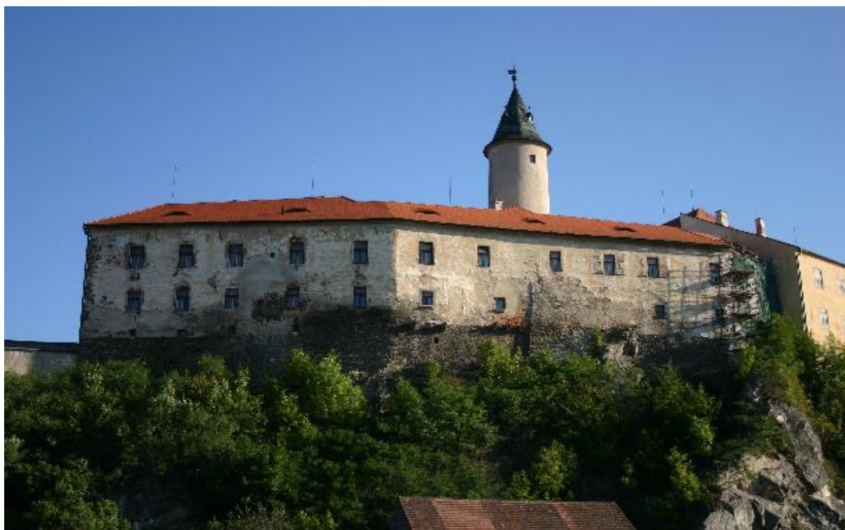
Stav objektu před opravou