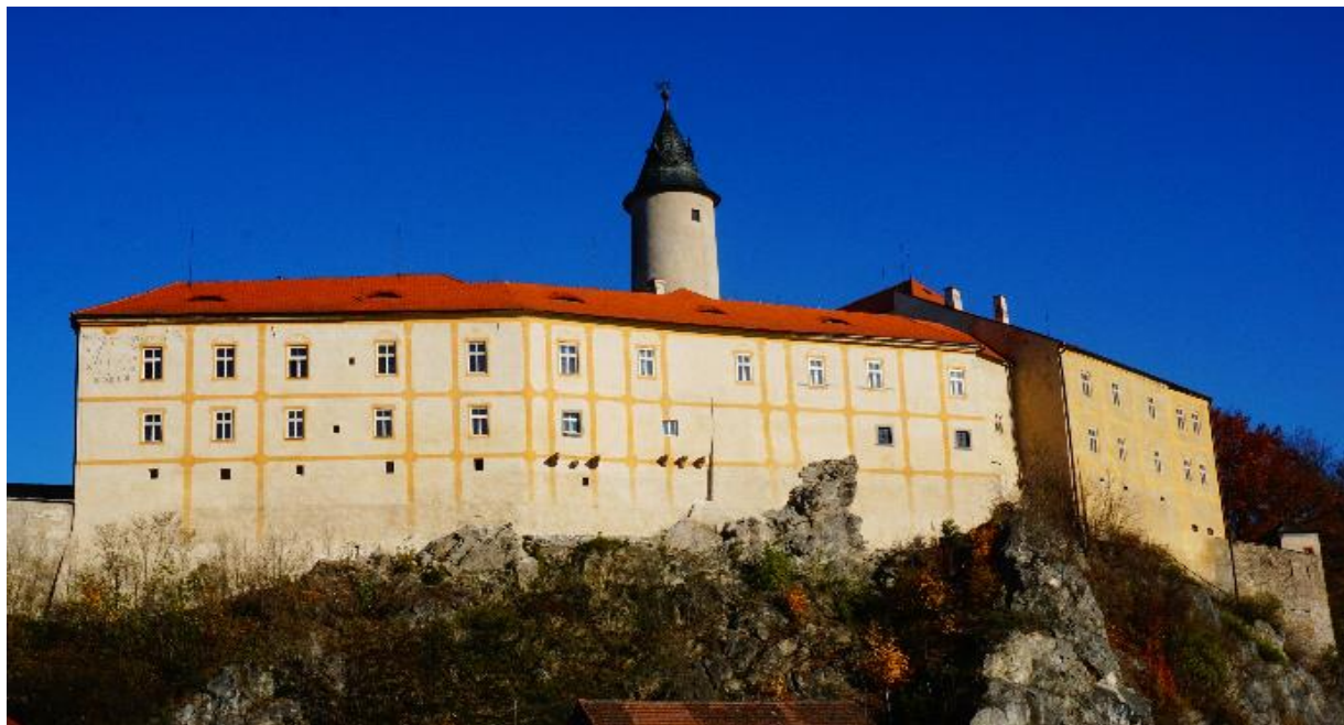
Stav objektu v roce 2015

celkové náklady v r. 2015 - 1 061 000,- Kč